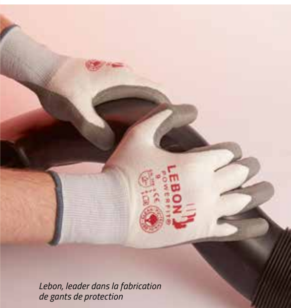
Lebon, leader dans la fabrication de gants de protection

i Groupe Lebon Z.A. La Renaissance 59490 Somain 03 27 90 91 13 lebon@lebonprotection.com www.lebonprotection.com